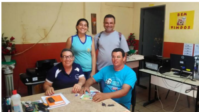
Diretoria do Sinte em visita a Escola Prof. José Américo.