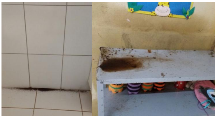
Escola Dr. Ricardo Simione no Assentamento Paraíso tem uma das piores condições encontradas. Fezes de morcego tornam o ambiente insuportável, além disso, muitos marimbondos. Infiltrações e goteiras estão presentes em todas as salas.