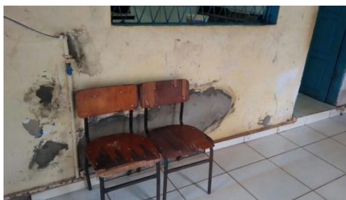
Parte externa da cozinha da Escola João Tomaz de Oliveira, no dia da visita do SINTE.