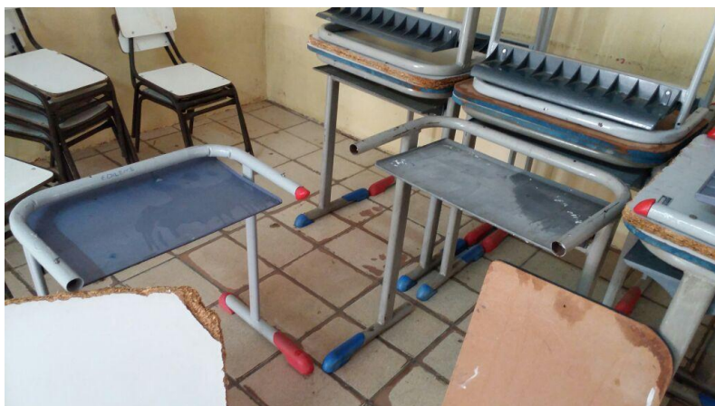
Falta de carteiras ainda é um drama em várias escolas tano na Zona Rural quanto na sede.