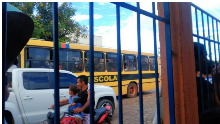
Problemas no transporte escolar são constantes.